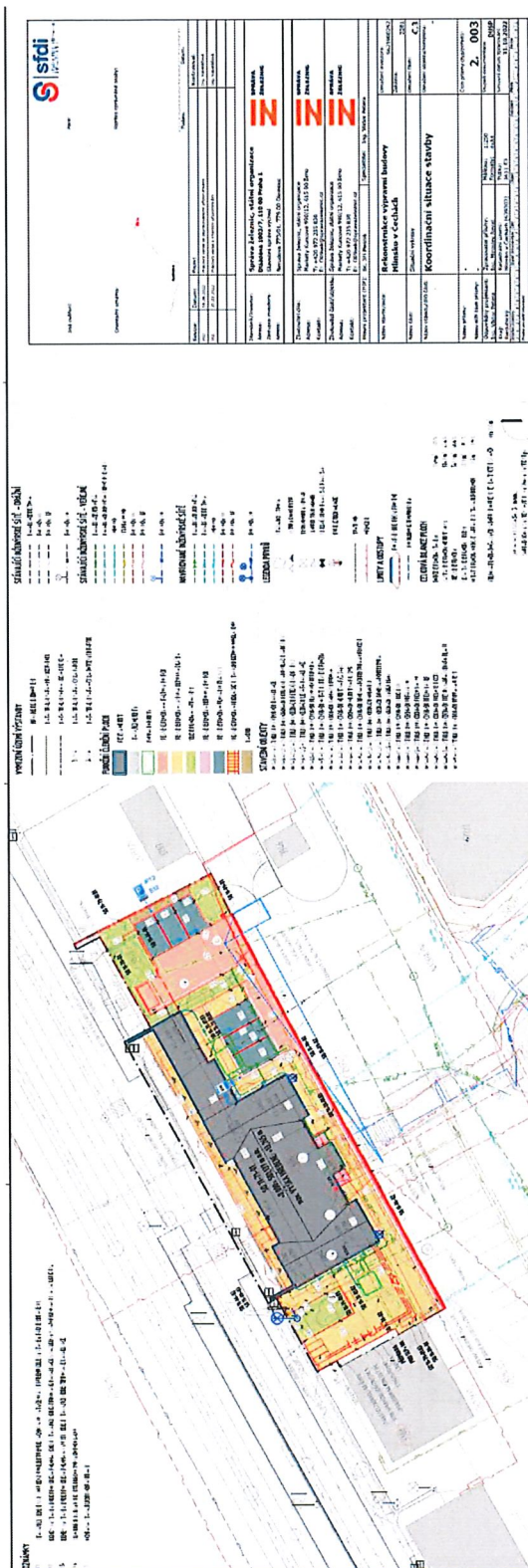
Obrázek č. 1: koordinační situace

Adresa: Městský úřad Hlinsko Poděbradovo náměstí 1 539 23 Hlinsko